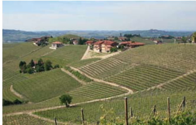
Die Top-Lagen der Produzenten del Barbaresco ziehen sich über die sanften Hügel und weisen unterschiedliche Bodenformationen auf

Zart, pinotartige Beerenfrucht, Waldboden; beeindruckend kompakt, dicht, vom mineralischen Unterbau begleitet, Tannin steht noch daneben, Harmonie zeichnet sich ab, von Eleganz und Mineralität geprägt, feines Entwicklungspotenzial.