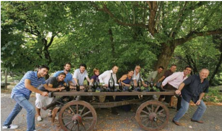
Gemeinsam geht es in die richtige Richtung: Die Winzer aus Barbaresco und Barolo können mit den Jahrgängen 2007 und 2006 jubeln und sensationell feine Weine aufwarten

„Nebbiolo prima“ nennt sich die neu organisierte Präsentation zur Vorstellung der aktuellen Weine aus Roero, Barbaresco und Barolo. Barbaresco 2007 und Barolo 2006 standen dabei im Mittelpunkt.